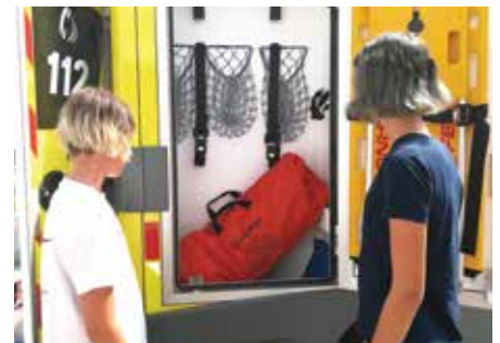
Reševalno vozilo ZD Bled ima vso sodobno opremo za reševanje življenj.