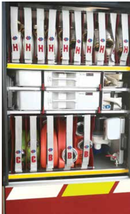
Gasilsko vozilo PGD Podhom ima najsodobnejšo opremo, primerno za različna reševanja.