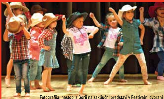
Fotografija: nastop iz Gorij na zaključni predstavi v Festivalni dvorani