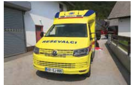
Zdravstveni dom Bled je le nekaj dni nazaj dobil novo reševalno vozilo za opravljanje nujne medicinske pomoči.