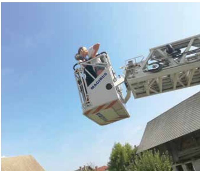
Reševalno lestev so obiskovalci lahko tudi preizkusili.