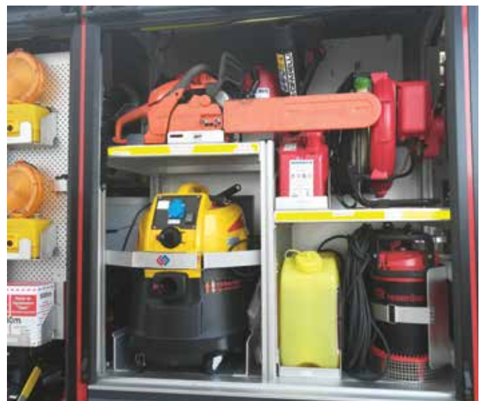
Del opreme novega gasilskega vozila PGD Podhom.