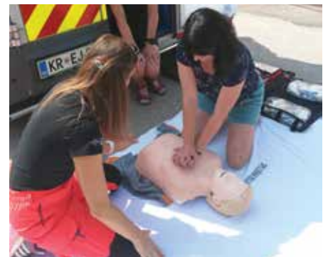
Obiskovalci so lahko preizkusili postopke oživljanja.