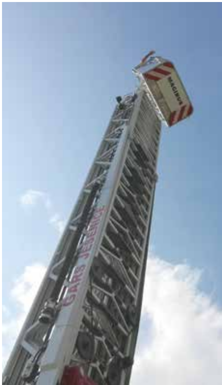
Jeseniški poklicni gasilci so predstavili reševalno lestev, ki se dvigne 40 metrov. Za njen nakup so moči združile vse zgornj- jegorenske občine.