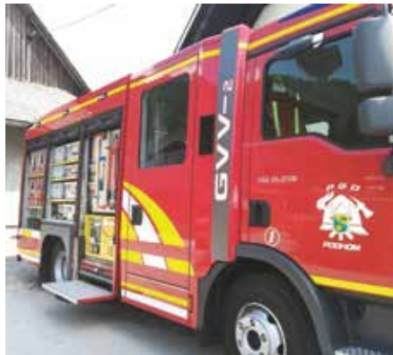
Dve leti staro gasilsko vozilo PGD Podhom.